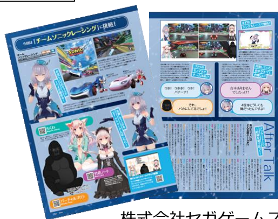
株式会社セガゲームス様