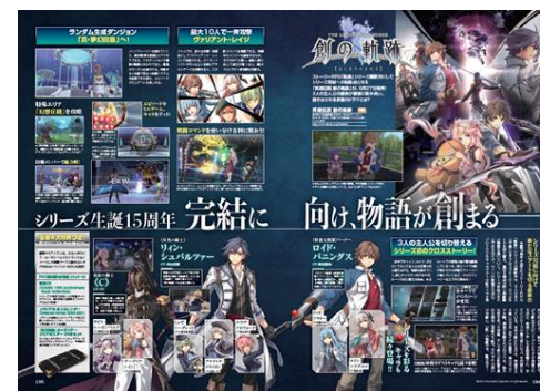
日本ファルコム株式会社様